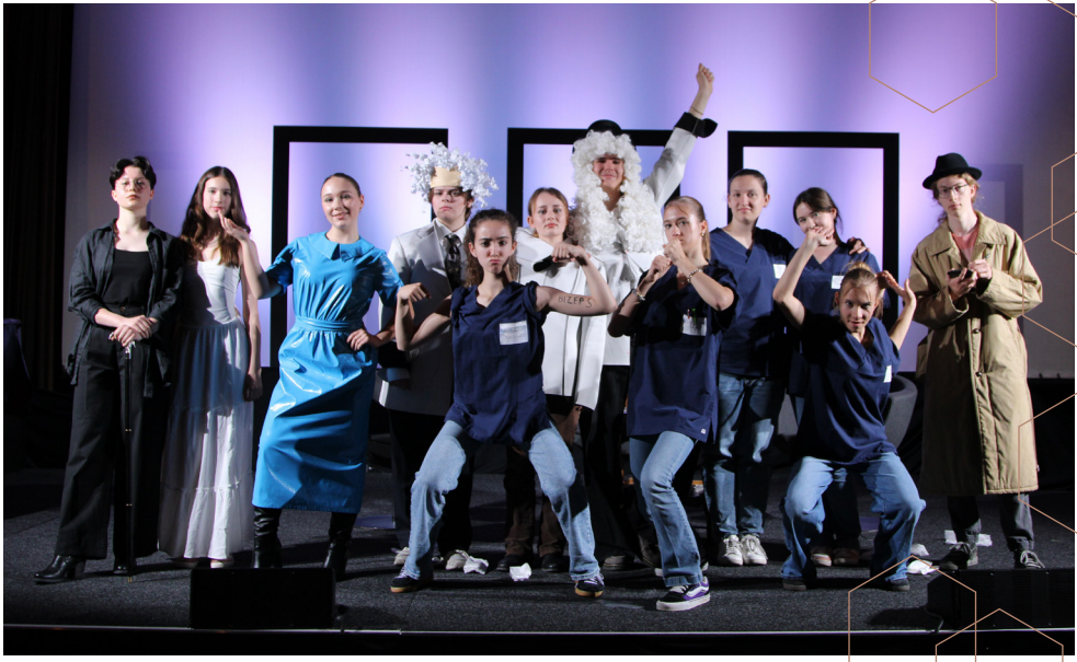
Aufführung der Theater AG: „Die Physiker“