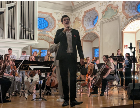
Kunstnacht: „1000 Jahre Burghausen“